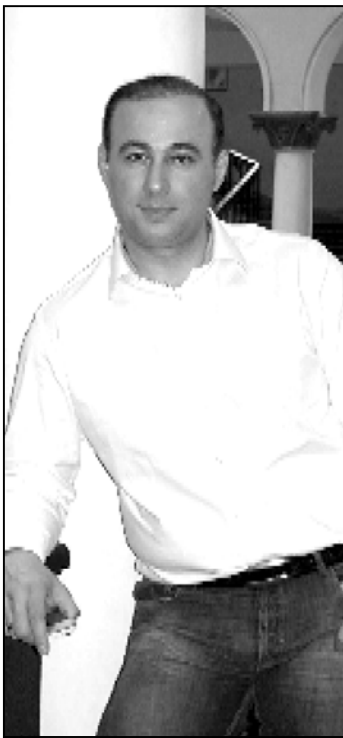
საპარლამენტო მდივანი გია ხუროშვილი

— არა, იქიდან გამომდინარე, რომ იმ დანერგულებებში, სადაც ჩვენ ვსაქმიანობთ, შეზღუდვებია. საჯარო სამსახური არ არის ის დანერგულება, სადაც ადამიანებს იმის დრო უნდა ჰქონდეთ, რომ სოციალური ქსელით