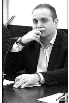
სოფს, 2009 წელს, ჩვენ აქციებში მონაწილეობას არ ვიღებდით, თუმცა, ჩვენ გვიწყევდა დაკავებული ადამიანების დაცვა.