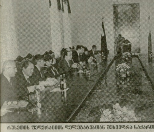
შუამოს გზების მშენებლობის პროექტი.

შუამოს გზების მშენებლობის პროექტი, რომელიც დაგეგმილია 1996 წელს დაიწყო, არის ქვეყნის მთლიანი შიდა პროდუქტის 0.5 პროცენტზე მეტი.