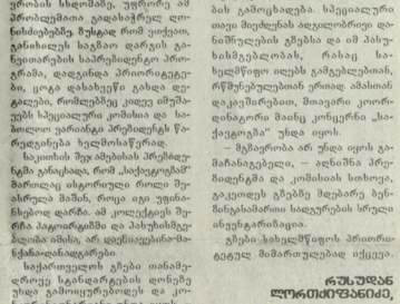
შუამოს გზების მშენებლობის პროექტი.

შუამოს გზების მშენებლობის პროექტი, რომელიც დაგეგმილია 1996 წელს დაიწყო, არის ქვეყნის მთლიანი შიდა პროდუქტის 0.5 პროცენტზე მეტი.