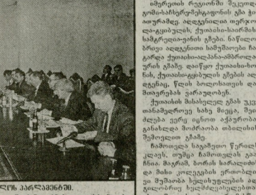
შუამოს გზების მშენებლობის პროექტი.

გზების მშენებლობის პროექტი, რომელიც დაგეგმილია 1996 წელს დაიწყო, არის ქვეყნის მთლიანი შიდა პროდუქტის 0.5 პროცენტზე მეტი.