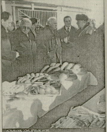
რუსთავის მეტალურგიული კომბინატი