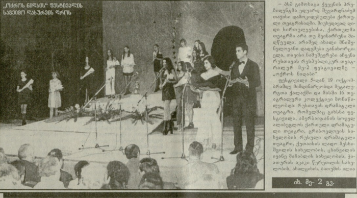
„ქორეოგრაფი“ ვახტანგ ლომიძის რეჟისურაში „ატიბათი“

„ატიბათი“ - ეს არის ქართული თეატრის ერთ-ერთი უძველესი სახეობა. მისი წარმოდგენები ხშირად მიმდინარეობს სოფლებში და სოფლის მეურნეობის დღესასწაულებზე. ატიბათის მომხრეები არიან როგორც სოფლებში, ისე ქალაქებში. მისი წარმოდგენები ხშირად მიმდინარეობს სოფლებში და სოფლის მეურნეობის დღესასწაულებზე.