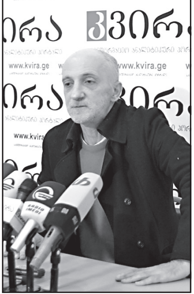
ჩვენი ქვეყანაში ისლამური სახელმწიფოს ინტერესზე რას იტყვი? ამბობან, რომ აუცილებლად შეეცდებიან კავკასიური დერეფნის ხელში ჩაგდებას.

მე ვნახე ინტერაქტივები და პრორუსული განწყობები ბევრად აჭარბებდა თურქულ განწყობებს. ვეჭვობ, რომ მთლიანად საზოგადოებაში შეიძლება, ასეთი განწყობები იყოს და ეს სერიოზული საფრთხეა. აუხსნათ საზოგადოებას, რომ თურქეთი არ არის დასავლეთი!