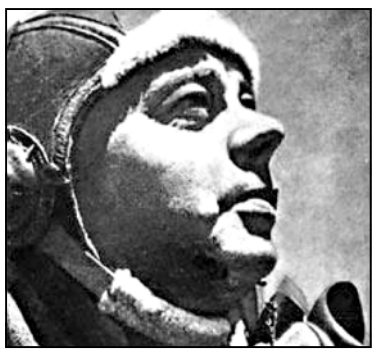
ბიძამისი თავის ახიხსოყიხაჯე ოჯახს და ხოგოხ შეიცვად მისდამი დამოკიდებულება მისი დღუპვის შემდეგ.

ცნობილი ფიანგი მნეხილს, ანგუან ე სენტ-ეზიუარეის დისნელი, ჯან დაგ, გასული წლის მინეხელ მოსოყს ენეა და გახუთმა “იხევაკიამ”-სახელოჯანი ბიძის შესახებ ინეხევი მამინ ჩამოახუთა. ინეხევიში იგი საუხიხობს იმის შესახებ, თუ ხოგოხ “ახევენდნ”