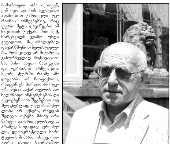
მიმართული არა იქითკენ, ვინ იყო და რას აკეთებდა ათასობით ქართველი უკრაინის არჩევნებზე, რაც უფრო მეტს დაიწყებდა იმ საქობის მიმართ, მით მეტ სირცხვილს გჭამო. უნდა ვეცადოთ, მაქსიმალურად დავარწმუნოთ ხელისუფლება, რომ კიდევ არ მიქრობს, განურჩევლად მოტივაციისა, მისი ასეთი ნაბიჯისა და უკრაინის არჩევნების მეორე ტურში რამე ამდაგვარი არ ჩაიფიქროს, რადგან ეს პირდაპირი უკუჩვენებაა ქვეყნის სახელმწიფო ინტერესების და აკეთებენ ამას შეგნებით თუ შეუგნებლად, უკვე მნიშვნელობა არ ექნება, რადგან შედეგი იქნება მძიმე არა მარტო საქართველოსთვის, არამედ ზოგადად ევროპული, დემოკრატიული სარტყელის მიმართ, ისევე, როგორც ისეთი საერთაშორისო ორგანიზაციებისთვის, როგორც არის სუამი. ერთია, როცა ქართველ უკრაინული ურთიერთობები ემყარება ტრადიციულ მეგობრობას, მეორე კი ეს შემთხვევა, როცა ასეთი ურთიერთობები ეფუძნება, ერთი ქვეყნის მხრიდან შეჭრილი ათასობით ადამიანის უპატივცემულობას, მილიანად უკრაინული ერის მიმართ. ნუ ეკედებით თავად მოჭირათ ის ხე, რომელზეც ჩვენ შეიძლება პერსპექტივის შეგვირად მოვკალით, გვეულისხმოს სწორედ ქართულ-უკრაინულ დერის, საქართველოს წარმომეწინა მოსოფლით, არა მხოლოდ ცცხლოვანი საშრეთი კავკასიის რეგიონის პირშიმოდ, არამედ უფრო ცივილიზებული შავი ზღვის ქვეყნებზე თუ ქართულ-უკრაინული ეს იმედი განვლავ, ჩვენ დავდებთ უკვე უარსადაც შავი ზღვისზე და საბით უკანასახისკე აი, ასეთი პერსპექტივა თუ ვინმეს ხილავდა საქართველოსთვის, დე დიად თქვას და დამკვირვებლის სახელი-სულდენო ბერკეფი.

— დაბს, სწორედ რომ ამ მეორე ვერისის მიმართ გამოხატე ჩემი ღრმა რწმენა მას შემდეგ, რაც რიგრიგობით გადკურდა დარწმუნებულება, როდესაც ჩვენი სანაქებო შინაგან საქმეში და უმშიშობების მინისტრი, რამდენიმე დღით ადრე აფეთქირებს დეტქს, რომ მისი პრეზიდენტის და უკრაინის პრეზიდენტის კანდიდატის სატელეფონო საუბარი მოსმენილია და გარკვევითადაა, ასეთი, ვიტყვობდი სამსახურებრივი დაუფერობა (უკეთეს შემთხვევაში), რომ რაღაც სამხედრო იპერკონის დაგეგმვა, მოიერმე ჯგუფებს გადასხმის სურვილით, რომელსაც შესაძლებელია ამოცანად დაუსახელოს უკრაინაში გადასახლებულმა, საქართველოს პარლამენტის თავდევინა და უმშიშობების კომიტეტის თავმჯდომარემ, მოახდინოს საკუთარი სურვილის აღსრულება დონცკოს ჰკური ანგვანად დაკვირვებით, ექვს ირეკვს იმდენად, რამდენადაც მე ბევრად მაღალი აზრის ვარ შეზარმაზანის პროფესიონალიზმზე და ასეთი ნაცვარში ჩავარდნილი კოეზი, მის კარიერის და მის შესაძლებლობებს არ ახასიათებს. ამიტომ წნდება ეჭვი, რომ ეს მორიგე სპექტაკლია, ეს გარკვეული აღიბის მატარებელი ფაქტობა, რადგან არათუ პრეზიდენტს, არამედ თურმე თავად შინაგან საქმეთა მინისტრებსაც უსმენენ. მით უმეტეს, სცყვარი იგვიყა, არც ერთი ამ საუბარებში მოხლეული ადამიანი არ უარყოფს სინაქდების ასეთი ჩანაწერების. ვფიქრობ, რომ რომ ახლა ყველა ჩვენგანის ყურადღება უნდა იყოს