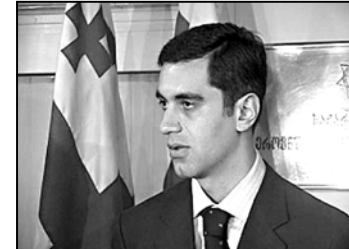
ბენ, რომ გერმანიაში ვიზიტის დროს სააკაშვილი პირადად შეხვედრია ხელისუფლების მიერ ოტებულ ხალვაშს.

ხალვაშმა შორეული გერმანიიდან დაიბარა, აუცილებლად დატრუნებინ და ქონებასაც დატრუნებინ. როგორც ამბობენ, სააკაშვილს მისთვის საქართველოში დაბრუნებაზე „აბაზო მითყია“, უფრო თამაში აზროვნების ადაბანებში კი აბეტიკე-