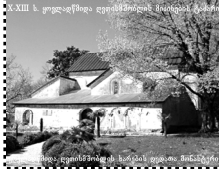
X-XIII ს. ყოვლადწმიდა ღვთისმშობლის მიძინების ტაძარი

„ლუჩია დი ლამერმურის“ პრემიერა ბათუმის თეატრში 28 იანვარს გაიმართება.