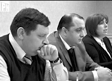
წინაშე და დაჯარიმდეს ან მისი ქონება დაექვემდებაროს დაფარებას.

სასამართლოები კვი ჯოჯოევი კვისთან მიმართებაში განხორციელებულ იქნა სხვადასხვა იურიდიული ქმედებები, მათ შორის მსოფლიოს მშენებელი აქტივების დაფარების გეგმვა. გიბრალტარის სასამართლოს მიერ გაკვეთილი აქტივების დაფარების გადაწყვეტილება ნათლად განმარტრებს, რომ ნებისმიერი პირი, რომელიც ინფორმირებულია ამ გადაწყვეტილების შესახებ და მიუხედავად ამისა, ხელს შეუწყობს კვის, გვერდი აუაროს მას, შესაძლოა წარდგეს სასამართლოს