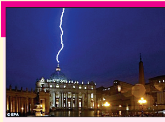
მაგიტო, გადადგომის შემდეგ პაპი გარკვეულ დროს თავის რეზიდენციაში გაატარებს, ხოლო შემდეგ საცხოვრებლად მონასტერში წავა.

გამომცემლობა „პალიტრა ელი“ აგრძელებს პროექტს „50 წიგნი, რომელიც უნდა წაიკითხო, სანამ ცოცხალი ხარ“. მისი პრეზენტაცია ქვეთარაძის ქუჩაზე მდებარე წიგნების მაღაზია „ბიბლუსში“ გაიმართა. მხოლოდ ერთი დღით, მთელი დღის განმავლობაში, 50 წიგნის პროექტი შემაგალი ყველა წიგნის შექმნა მსურველებს 7 ლარად შეეძლო. – გამომცემლობამ პროექტის გაგრძელებით მრავალრიცხოვან მკითხველთა სურვილი გაითვალისწინა. საუკუნის პროექტი შემდეგი სახელწოდებით გაგრძელდება – „50+ ბიბლია + კიდევ 49, რომელიც უნდა წაიკითხო, სანამ ცოცხალი ხარ! 100 წიგნი ჩვენს თაროზე“. პროექტი „50 წიგნი, რომელიც უნდა წაიკითხო, სანამ ცოცხალი ხარ“ სამი წლის განმავლობაში, განსაკუთრებული წარმატებით მიმდინარეობდა. წიგნების გამოსვლას წინ უსწრებდა ხანგრძლივი გამოკითხვა, რადგან ეს, საერთაშორისო მოთხოვნის მიხედვით, საზოგადოების მიერ არჩეული წიგნები უნდა ყოფილიყო. აგრეთვე მას უნდა გამოეკვეთა ამ დროის ლიტერატურული გემოვნება და აესახა საზოგადოების ლიტერატურული მისიერება. გამოკითხვამ 80.000-მა ადამიანმა მიიღო მონაწილეობა და ახლაც გრძელდება. მკითხველთა მხრიდან გამოიკვეთა ორი გზავნილი პროექტის მიმართ – პროექტში ბიბლიის, როგორც მთავარი წიგნის შეტანა და