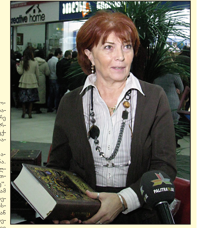
გაგრძელება მე-8 გვერდზე

ყველამ გაითვალისწინეთ! წარმატებული დღეა პირი – საინტერესო დღეა, ბევრ ახალ რამეს გაიცნობ. ქარი – ფული გაქვთ, პრობლემა არ განუხებთ. მყვანი – საქმე კარგად წაგივით, მთავარი იაქტიურად. ქირისი – რომანტიკული თავგადასავალი კარგ ხასიათზე დაგაყენებთ. ლირი – ფული გაქვთ, ახალ საქმეს წამოიწყებთ. ქალწი – უარი არ თქვით შემოთავაზებებზე, ჯერ კარგად დაფიქრდით. სასრი – გადაიხადისეთ გარდერობა, შეხვედრათ მიდისხართ. ღიანაი – ფულს შოულობთ, ცოტაც მოითმინეთ და პრობლემას მოაგვარებთ. მედიანა – არ აჩქარდეთ, მშვიდად იმოქმედეთ. მისი რაა – სასიამოვნო სიახლე გელით, აღფრთოვანებული ხართ. მარწილი – საქმე კარგია, მაგრამ საკუთარ თავს დღეს მაინც მიხედეთ. თავსა – მეგობრების წრეში კარგად გაერთობით, მათგან კარგ ამბავსაც გაიცნობთ. გისეხებთ ბედნიერ დღეს!