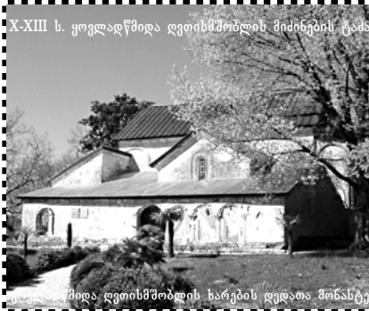
მთა, დროისმშობლის ხარების დღდას მონასტერი

— პრეზიდენტმა პარლამენტში გამოსვლისას საკმარისი მკავრად გააკრიტიკა ნოლიდელის ქმედება და მოლატატედ ვერაცხვა, თუკი საზოგადოებაში ბევრი კითხვის ნიშანი ჩნდება. თუკი ნოლიდელი ქვეყნის მოლატატეა, რატომ არის ხელისუფლება ასეთი ინერტული მის მიმართ? — ამ ხელისუფლებამ რაც არ უნდა იმოქმედოს, იმ კავშირებს, რომელსაც არსებობს რუსეთის წარმომადგენლებთან ძალიან დაბალ დონეზე, ეს ურთიერთობები არ ასცდება, როდესაც რუსეთის პრეზიდენტი პირდაპირ განაცხადებს, რომ მისთვის მთელფელია სააკაშვილი და მისი ხელისუფლება. ეს უკვე ნიშნავს იმას, რომ რუსეთი არ დაუკავშირებს სააკაშვილთან. რაც შეეხება სააკაშვილს, ამ ვითარებაში მას მხოლოდ ერთი გზა აქვს დაჩრჩნელობა — რაც შეიძლება მკვეთრად აგიოს — რუსეთის წემთვის სულაც არ არის გასაქარა, რომ სააკაშვილი მოლატატე ვერაცხვა ავთივად, ამიტომ, აქედან გამომდინარე, დღეს, რომელიც თითქმის ყველა ოპოზიციის უძისონ, შემოკლებულია, იმდენად შეჭვია ჩვენი ყურები ამ სიტყვას, რომ მას მნიშვნელობა უკვე დაკარგა, ისე, როგორც სააკაშვილის ყველა სიტყვამ და დაიბრუნა დაკარგა მნიშვნელობა, ანუ მოხდა ამ სიტყვების დევაკლაცია. აქედან გამომდინარე, რაც არ უნდა იყვიროს სააკაშვილმა, ეს აბსოლუტურად არაფერს ნიშნავს.