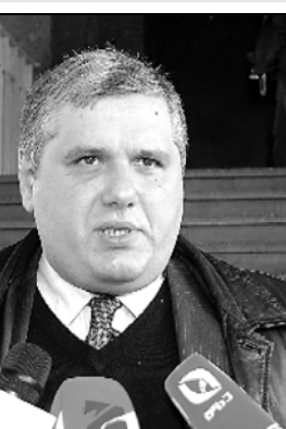
„ალიანსი საქართველოსთვის“ პოლიტიკური ყოფილი პრაიმერის ტიპი ძალიან გაკვირებული არიან და მათ სიტყვის უკან წაღებაში ადანაშაულებენ.

ბევრი იდევს თუ ცოტა, დავითაშვილი და კუკუა სოციოლოგიური კვლევის დაითანხმეს. ეს თანხმობა მათ ალასანიას გადმოიხრების ხაზით თქვეს. ის კი ისევ უარზეა. ამის მიუხედავად, ან უკვე ყოფილი პრაიმერის ტიპი ერთიანი კანდიდატს კვლევი გამოავლენენ.