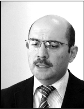
სამზავნო თვითმფრინავების წარმოებასთან დაკავშირებით უღოს კანდიდატურას წარაგვანს.

ანკაპილის კომისიაში უღოს კანდიდატურას წარაგვანს.