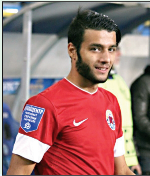
დასაწყისი მე-8 გვერდზე