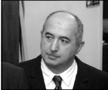
ნინო ბერიძე, საქართველოს სპეცსამსახურების მეთაური

— ბატონო პაატა, ინფორმაციის მიწოდება იმდენად მნიშვნელოვანია, რამდენადაც თქვენს ინფორმაციას დასაბუთებული აქვს. თქვენ როგორ შეფასებთ ამ ინფორმაციას? — ეს არის ტერორისტების ადრეული აღმოჩენა და მათი დაპატიმრება. ეს არის სპეცსამსახურების მუშაობის შედეგი. იმდენად მნიშვნელოვანია, რამდენადაც თქვენს ინფორმაციას დასაბუთებული აქვს. თქვენ როგორ შეფასებთ ამ ინფორმაციას? — ეს არის ტერორისტების ადრეული აღმოჩენა და მათი დაპატიმრება. ეს არის სპეცსამსახურების მუშაობის შედეგი. იმდენად მნიშვნელოვანია, რამდენადაც თქვენს ინფორმაციას დასაბუთებული აქვს. თქვენ როგორ შეფასებთ ამ ინფორმაციას?