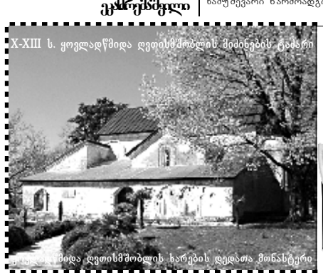
მისი აღმოსავლეთის ხარების დედათა მონასტერი