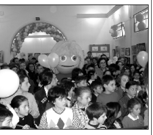
გამოფენაში მონაწილე ბავშვები და მათი ნამუშევრები.

ყველა ნომინანტმა მიიღო სუენერბები და “ბალის“ სიმბარბოები “ოქროს ნომრით“, ასე რომ გულდაწყვეტილი არავინ დარჩენილა. “მაგეიკომის“ გადაწყვეტილებით, 2010 წელს კალენდარიც