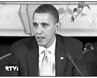
ინფორმაციის დამუშავების შედეგად.

აშშ-ის პრეზიდენტმა ბარაკ ობამამ განაცხადა, რომ ირანის წინააღმდეგ საერთაშორისო სანქციების შემოღება უახლოეს მომავალში ისურებად. ფრანგ კოლეგასთან, ნიკოლა სარკოზისთან ერთობლივ პრესკონფერენციის დროს ბარაკ ობამამ განაცხადა, რომ გაეროს მიერ სანქციების რეჟიმის შემოღების თვითონ ლოდინს არ აჩერებს. საფრანგეთის ლიდერმა ასევე განაცხადა, რომ მკაცრი ზომების მიღების დრო დადგა.