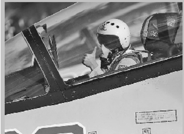
ოპარაციამ სირიაში აუტონომიურად „გლობალური მოაზროვნის“ წოდება FOREIGN POLICY-ის ვიზიტით

ამერიკული გამოცემის რეიტინგში რუსეთის ფედერაციის პრეზიდენტი შევიდა კატეგორიაში „იმ ადამიანებისა, რომლებიც ლეზბიანობაზე განდევნილებულნი არიან“. გამოცემის აზრით, რუსეთის ფედერაციის პრეზიდენტმა ეს წოდება მოიპოვა სირიაში საჰაერო ოპერაციების გამო. ამავ დროს Foreign Policy-ის გამომცემლობაში ნათქვამია, რომ ვლადიმერ პუტინი შეიტანეს რეიტინგში „მშვიდობისმყოფელის როლისათვის, რომელიც ყრის ბომბებს“.