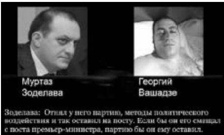
ზოდელავა: Отыл у него партни, методы политического воздействия и так оставил на посту. Если бы он его сменил с поста премьер-министра, партию бы он ему оставил.

„რეზონანსი“ გუნდს საქართველოდან ოდესის გუბერნატორი მიხეილ სააკაშვილი ხელმძღვანელობს, რომელიც სხვადასხვა სახის უსაფრთხოების ყველა სტრუქტურა უკვე დაიქვემდებარა. მაგალითად, ოდესის მილიციის სათავეში საქართველოს შს მინისტრის ყოფილი მოადგილე გიორგი ლორთქიფანიძე უდგას. პროკურატურას ფორმალურად დავით საყვარელიძე ხელმძღვანელობს, თუმცა დე ფაქტოდ, მას მურთაზ ზოდელავა განაგებს, რომელიც საქართველოს გენერალური პროკურატორი გახლდათ.