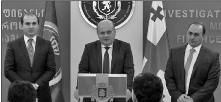
ციული სააგენტოს უფროსის მოადგილე, ხოლო 2014-2015 წლებში საქართველოს მთავარი პროკურორის თანამდებობას იკავებდა.