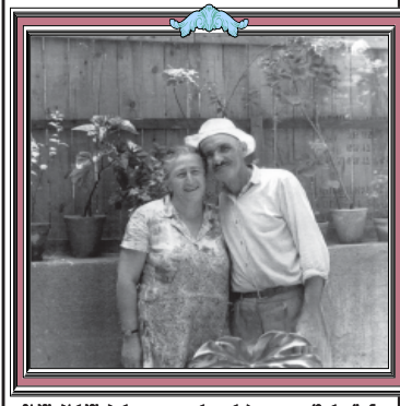
მამის პირველი პრეზიდენტი ეკვლას რაიმე აქვს სახსოვარი... მთელი ცხოვრება მისი მამის გარშემო იმყოფებოდა.