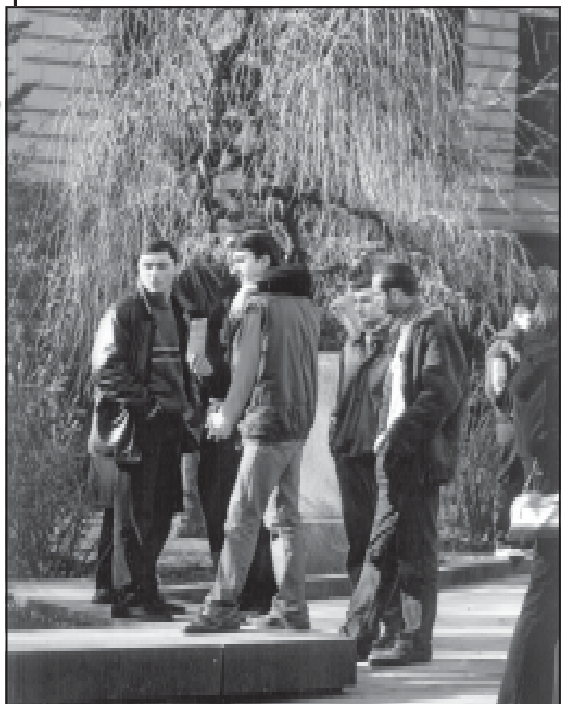
ბიჭები. ჩვეამ კასრბის ფოტო.