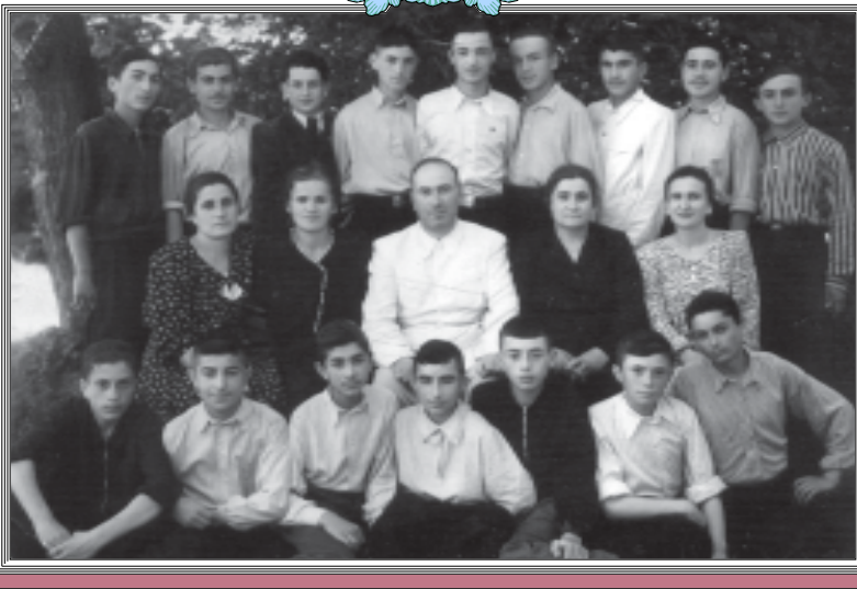
თელავის ვაჟთა პირველი საშუალო სკოლის მოსწავლეებმა ეს სურათი 8 კლასის დამთავრებისას გადაიღეს. 1950 წელი.