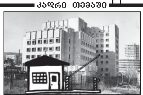
საკლავო რიოთის შტაბებში პროკურატურის შენობასთან. მუშაობის პირიქით: ჩადე მილიონი, გააბრე!

ჯარისკაცებმა რომის იმპერატორად გამოაცხადეს, ერთობ გონიერი და ენერგიული კაცი იყო. გახტმე ასე-ვლისთანავე შეუდგა იმპერიის მოშლილი ფინანსურ-ეკონომიკური და პოლიტიკური მდგომარეობის მოწესრიგებას. განაახლა საგადასახადო სისტემა, შემოიღო ახალი გადასახადები. ამან ფართო სამშენებლო საქმიანობის გამოსის საშუალება მისცა (სხვათა შორის, აღადგინა გადამწვარი კაპიტოლიუმი, ააგო ფორუმი და დაიწყო კოლუმეუმის მშენებლობა). ეს ის კაცი გახლავთ, რომლის კვითვსაც გვიყვარებოდა მცხეთაში აღმოჩენილი ბერძნულწერიანი ქვა: ვესპასიანე და მისმა შვილებმა „იბერთა მეფეს მით-