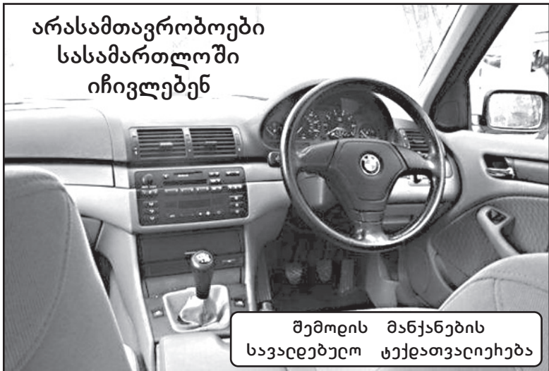
არასამთავრობოების სასამართლოში იჩივლებენ