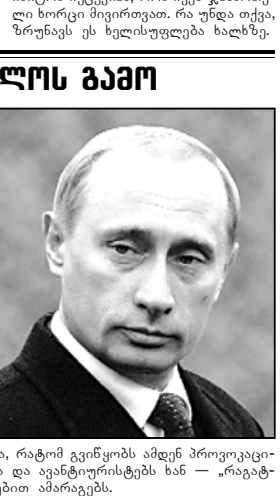
ამის შემდეგ ამ პრემიერის პრესმდივანმა...