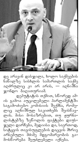
დე არაინ დასჯილი, ხოლო საქმეების ნაწილზე...