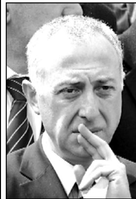
ამასთან დაკავშირებით საგანგებო...