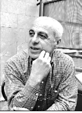
და ავილი პირადად მე, ეს არის ჩემი შვილი...