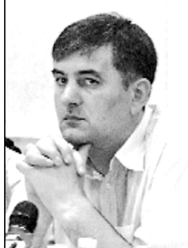
ტიის ირგვლევი განვითარებული მოვლენების შესახებ.

მისივე თქმით, ქართული პარტია უსიხვედრე დიპლომატებს სისტემატორად მაინვდის ინფორმაციას პარ-