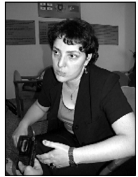
რეს, სხდომაში მონაწილეობის მიღების მსურველ ადამიანებს ხელმოწერი ბარეტი არ შეუძლება. ინტერნესიუსი

— ბოლოდროინდელმა მოვლენებმა თბილისისთვის სრულიად ნათელი გახადა, რომ „რესპუბლიკების“ მიერ ოთხი წლის განმავლობაში თბილისის წყლის დანაშაულებრივი საქმიანობის შესახებ გაკეთებული ყველა განცხადება დასუფთავების და დასაბუთებული იყო. თბილისის დასუფთავების გადასახადის ახალი წესის შემოღებამ მოსახლეობის შინაგულ-ლოვანი ნაწილის სერიოზული შემოთხება გამოიწვია. „რესპუბლიკელები“ შევეცდებით, ყველა მქაზნისში გამოვიყენოთ, რათა არ დავუშვათ ამ კაბალური ვალდებულების დაკისრება თბილისელებისთვის, — აცხადებს ხიდაშელი. „რესპუბლიკური პარტია“ მიმართავს დაინტერესებულ პირებს, იმ ადამიანებს, ვისაც შეუძლიათ აღნიშნულ საკითხზე კვალიფიკირად იმსჯელოს, ექსპერტის ჩაატაროს, მიიღოს მონაწილეობა საკრებულოს ზეგანგებულ სხდომის მუშაობაში. თინა ხიდაშელი მიმართავს ასევე საკრებულოს თავმჯდომარეებს.