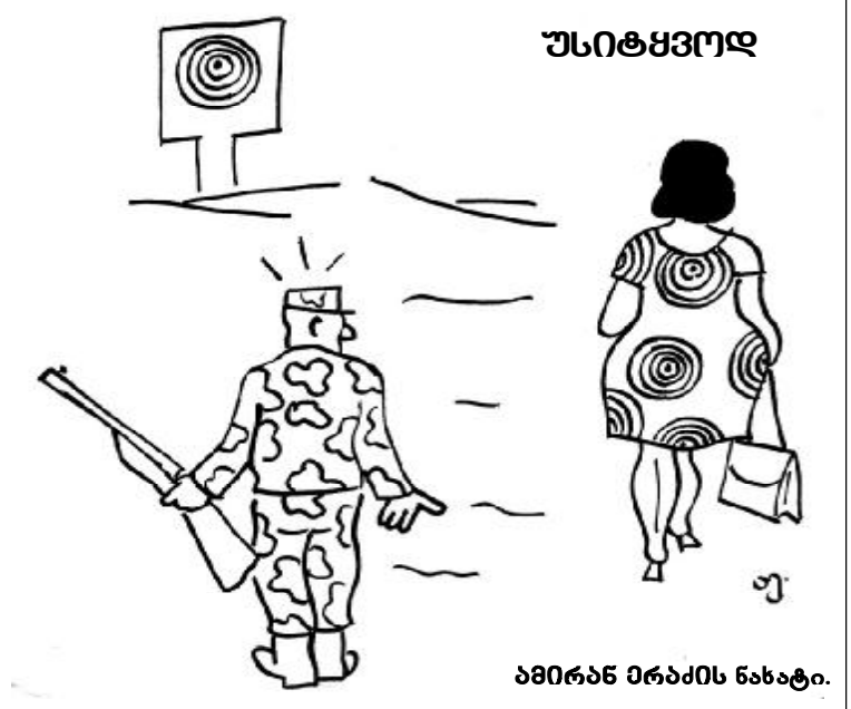
ამირან მრამის ნახატი.