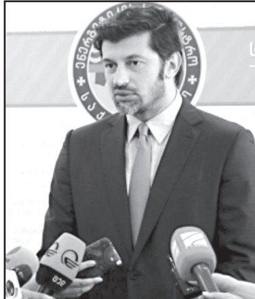
ქვეყანაში. მინდა, კიდევ ერთხელ განვმარტო და მოსახლეობას სწორი ინფორმაცია მივანდო, რომ ეს არის სიცრუე, — განაცხადა კალაქემ.

ზამთარში არანაირი გრაფიკი არ იქნება, ელექტროენერჯის მიწოდება ჩვეულებრივად უწყვეტ, 24-საათიან რეჟიმში გაგრძელდება. ამის შესახებ ვიცეპრემიერმა, ენერჯეტიკის მინისტრმა კახა კალაქემ ჟურნალისტებს იმ კითხვის საპასუხოდ განუცხადა, თუ რა ვითარება იქნება ზამთარში ელექტროენერჯის მიწოდებასთან დაკავშირებით. როგორც კალაქემ აღნიშნა, კომპანიებმა ყველა დაგეგმილი სარეაბილიტაციო სამუშაო ჩაატარეს. — არანაირი პრობლემა არ გვაქვს ზამთართან დაკავშირებით. კომპანიებმა ყველა სარეაბილიტაციო სამუშაო, რომლებიც მათ დაგეგმილი ჰქონდათ, გაზაფხულ-ზაფხულის პერიოდში ჩაატარეს. გარკვეული ადამიანების დაჯგუფება ცდილობდა, რომ ქალის შემოღებამ, თითქმის ელექტროენერჯის მიწოდება გრაფიკით იქნებოდა