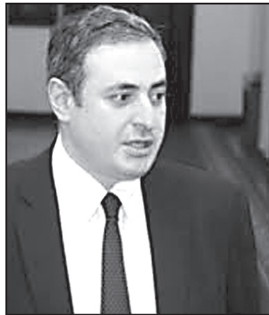
განხეთქილება ნაციონალებში იზრდება

უკრაინულ მედიაში გამოქვეყნებული ჩანაწერის თანახმად, გოკა გაბაშვილი უკრაინაში მყოფ მიხეილ სააკაშვილს, ზურაბ ადეიშვილს, დავით საყვარელიძეს, ასევე მურთაზ ზოდელავასა და გიორგი ვაშაძეს უცნებურ სიტყვებით მოიხსენიებს და ამბობს, რომ სააკაშვილს გვერდით მონები უნდა.