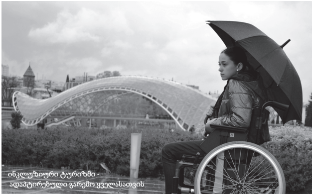
ინკლუზიური ტურიზმი - ადაპტირებული გარემო ყველასათვის

დღეს, როდესაც ტურიზმი, საქართველოს ეკონომიკის განვითარების ერთ-ერთ პრიორიტეტულ სფეროდ არის აღიარებული და ამასთანავე მიმდინარე წელი გამოცხადებულია შეზღუდული შესაძლებლობის მქონე პირთა უფლებების დაცვის წლად, განსაკუთრებით მნიშვნელოვანია საფუძველი ჩაეყაროს ინკლუზიური ტურიზმის განვითარებას საქართველოში, სადაც ტურისტული მომსახურებით ისარგებლებს არა მხოლოდ საქართველოში მცხოვრები, 250 000 შეზღუდული შესაძლებლობის მქონე პირი, არამედ საზოგადოების მრავალი სხვა წევრი.