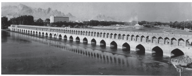
ალავერდი-ხან უნდილაძის მიერ აგებული 33 თალიანი ხიდი ისპაჰანში, მდინარე „ზაიანდე რუღზე“

ალავერდი-ხან უნდილაძე ჭკვიანი, გამოცდილი და განათლებული პიროვნება იყო. მისი დამსახურებაა ისპაჰანში – მაშინდელ დედაქალაქში მდინარე ზაიანდე-რუღზე, რომელიც ქართულად დედა მდინარეს ნიშნავს, ოცდაცამეტ თალიანი ხიდის აშენება. იგი ამჟამადაც ფუნქციონირებს და მის სახელს ატარებს. ხიდი ორსართულიანია, კედლები თხელი ქართული აგურით არის ნაშენი. ზედა სართულს ამშვენებს რამდენიმე ძალიან ლამაზი გუმბათი, იგი დაახლოებით 100 მეტრის სიგრძისაა. ქვედა სართულზე გაკეთებულია შეჭრილი ოთახები, რომლებშიც ჩაიხანებია გახსნილი. ეს გრილი და სასიამოვნო ადგილი ყოველთვის სავსეა ტურისტებით, თუ ადგილობრივი მაცხოვრებლებით, რომლებიც ჩაის სვამენ და ყალიონსენევიან. უნდილაძის მიერ აშენებული ხი-