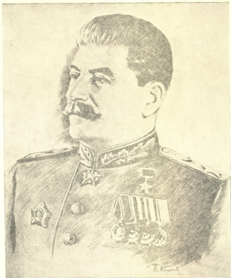
იოსებ ბესარიონის-მა სტალინი