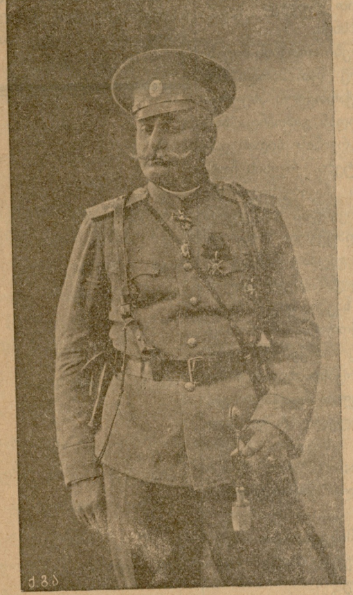
გენერალი ვახტანგ ვაზაშვილი დაჯილდოვებულ იქნა წმ. გიორგის ჯვრით

ამვე დროს ქართველის გამოღვიძებულ და საძიერად გამოსულ ტენის მაცდუ- რად სდარაჯობდა ევროპის გონებრივ სა- კულტურაში გამოცხადებულ ქედებს და ისიც, რასაკვირველია, ამით წაწვედა ხარ- ბად. მექანიკური ცნობილია პრინციპი: სხეული იქითკენ მიექანება, საცანაკლები წინააღმდეგობა გზათ დაუხვდება. და აბა საყვედური გვეთქმის, რომ ჭბუტის დამ- შუღლმა გონებამ მზა-მზარეულს მიატანა. ეს მასიური მოვლენა იყო საქართველო- ში. ინტერ-ეროვნული და სოციალის- ტური პრინციპი დაუფლა პირველ- ყოფელ მეთურნობის ქვეყანას და ჩვენში ნახსენები სიმახინჯის აპოლოგეტად გა- მოვიდა. და მდიდდურად ჰყვარდა ჩვენი გონებრივი მანკის ნამეტნაობის ყვავილი!