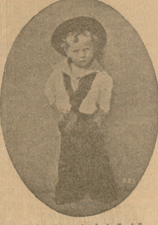
იმპერატორი ვილჰელმი ბავშვობაში.

ამასობაში უფრო და უფრო გამკაცრ- და შემოტევა. ქვეყანას ფერდები ჩაუ- ღეწეს. როდის-როდის მოესმა კურთა საქართველოს მიწის განპობის ხმა. ზოგს უსიამოვნოთ დაემანჯა ბარისახე, მაგრამ საერთაშორისო იდეალების სიყვარულმა, ჩაუღმდგარი ქარიშხალივით ჩვენში რომ უბერავდა, გაუქარვა სევდა სიქარიით.