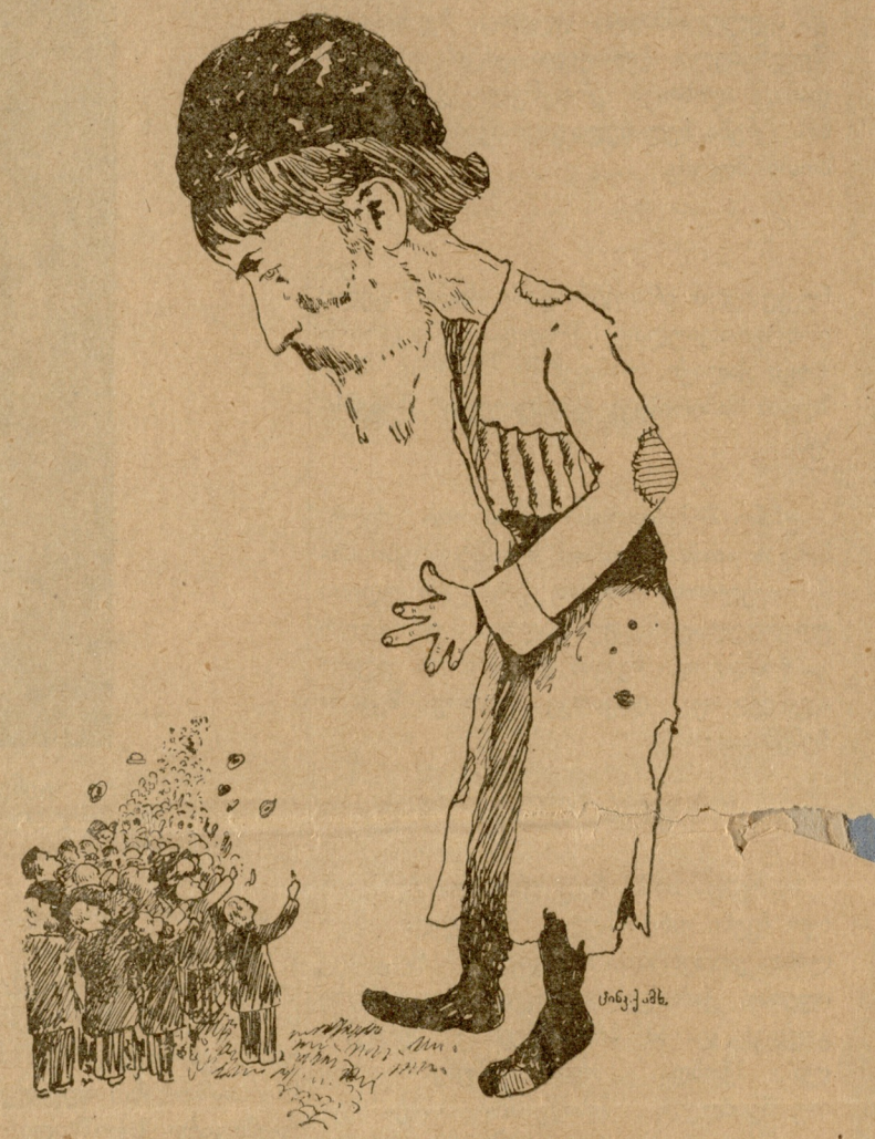
ვაჟა-ფშაველა (მორცხვად) შემნიშნეს...