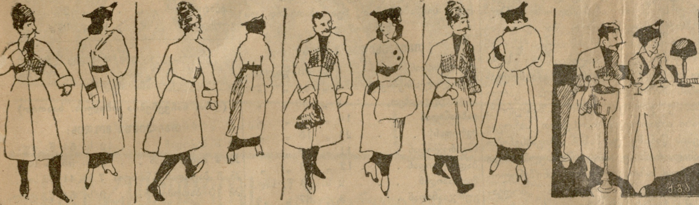
პირველი მობილიზაცია პირველი იერიში ბრძოლა დიპლომატიური მომზადობიანად ბანაკში