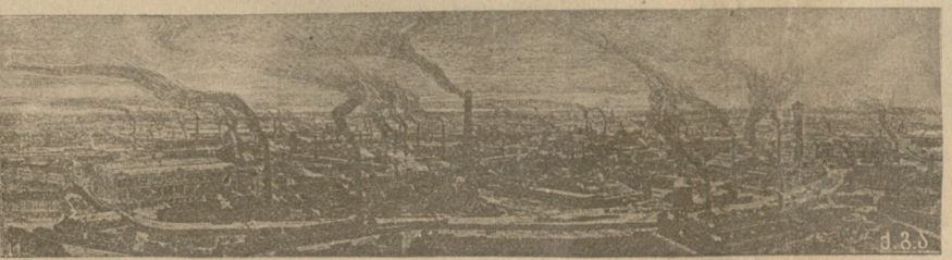
ბუდე გერმანიის ძლიერებისა. ზარბაზნების ქარხანა განთქმულ კრუპისა ქალ. ესენში.