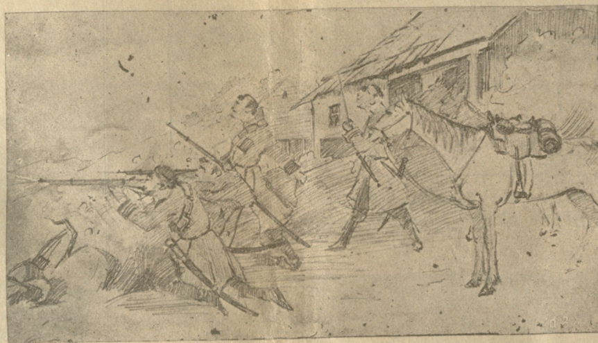
ქართველი, რაჭმელის პოზიციებზე.