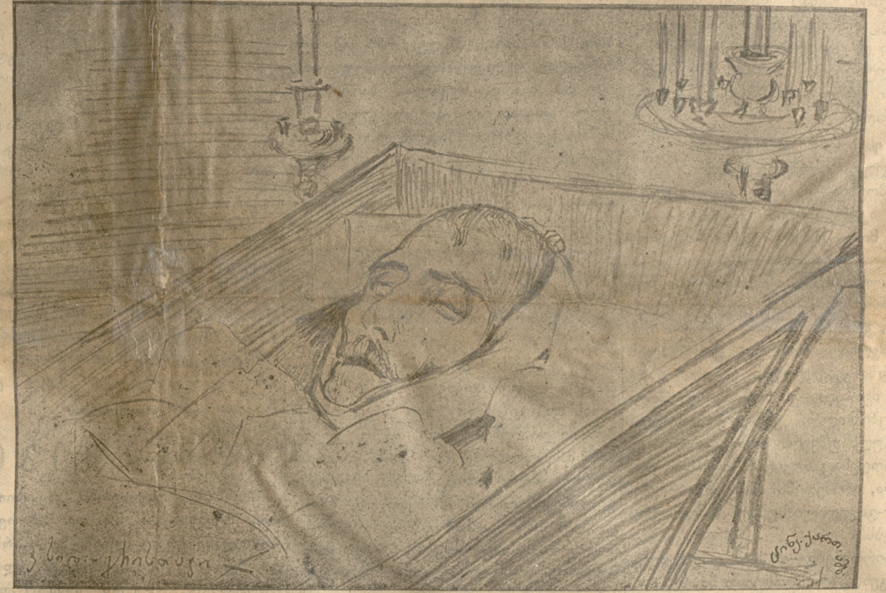
ვაჟა-ფშაველა ყინულიან ჭურჭლში