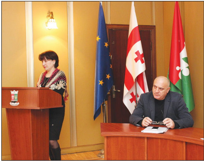
„ალიონი“. 9 დეკემბერს, ქალაქ ოზურგეთის მუნიციპალიტეტის საკრებულოს მორიგი სხდომა გაიმართა.