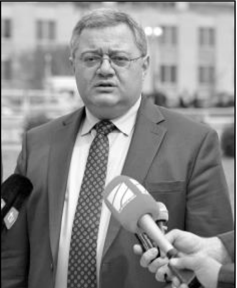
შანტაჟება და მათი პოლიტიკური მომავლის საკუთარ საეჭვო პოლიტიკურ მომავალთან სრულად დაკავშირება. უფროსილდით მას, ნუ დარჩებით სტერეოტიპების ტყვეობაში, დარჩით ევროპელები.

ამიტომ, ბატონო ევროპარლამენტარებო ევროპის სახალხო პარტიდან, მოგიწოდებთ, თავი შეიკავოთ სიცრუეზე დაფუძნებულ მსგავს განცხადებებზე ხელმოწერისგან. ამის გამო მალე თავადვე შეგრცხვებათ. ისევე, როგორც, ალბათ, უკვე რცხვენიათ თქვენს თანაპარტიელებს, ვინც ევროსაბჭოს საპარლამენტო ასამბლეას „შეფოთება“ გამოათქმევინა საქართველოში არჩევნების შემდეგ ტელეკომპანიის მესაკუთრის ცვლილების გამო და მხოლოდ შემდეგ გაარკვიეს, რომ თურმე სააკაშვილის მიერ 2007 წელს დარბეული, მესაკუთრისთვის წართმეული და მისი ადმინისტრაციის უფროსისთვის გადაცემული ტელეკომპანია „იმედი“ დაუბრუნებია კანონიერ მესაკუთრეს. მიხეილ სააკაშვილმა უკვე მოახერხა ქვეყნის შიგნით და ქვეყნის გარეთ ბევრის და-