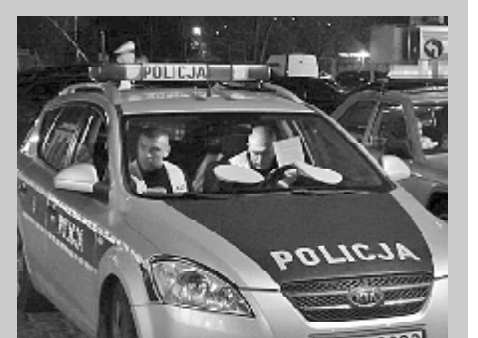
მომხდარის ადგილზე პოლიციამ 37 წლის მამაკაცი დააკავა, რომელიც ცდილობდა გაენადგურებინა საფლავის მორიგი ქვა. ვანდალი იქცეოდა მტრად აგრესიულად, შეურაცხყოფას აყენებდა პოლიციელებს და თავსაც კი დაესხა მათ.

აქლენითი დაბაჰაზის მანდალი, რომელიც საბჭოთა სასაზღვაოში 11 კმ-ით დააზიანა