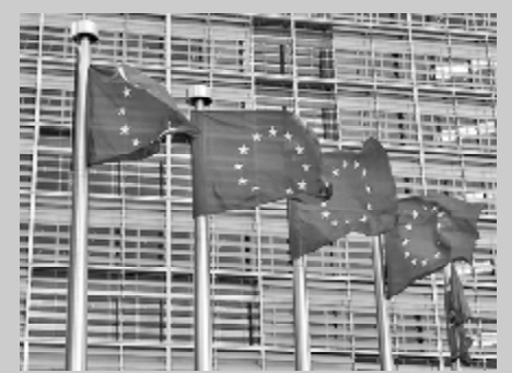
გადაწყვეტილება რუსეთის წინააღმდეგ ევროკავშირის სანქციების გაბრკელების შესახებ კიდევ ნახევარი წლით ახლაში შევიდეს

როგორც წინა დღით იუწყებოდნენ, გადამწყვეტილება ანტირუსული სანქციების განხორციელების შესახებ შეათანხმა ევროკავშირის საბჭომ. ცნობაში მითითებულია, რომ გადაწყვეტილება მიღებულია იმ გაგებასთან დაკავშირებით, რომ მინსკის შეთანხმებანი უკრაინის კრიზისის მოწესრიგების შესახებ არ იქნება მთლიანად შესრულებული 2015 წლის 31 დეკემბრამდე.