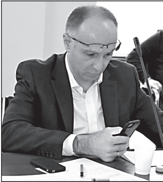
საარჩევნო სიის პირველი ნომრის გამოსავლენად ნაცმოძრაობა პრაიმერიზს ჩაატარებს

– არა, ამაზე საუბარი არ ყოფილა და არც მიშას გამოუთქვამს ამის სურვილი. უბრალოდ, ეს იყო თეორი-