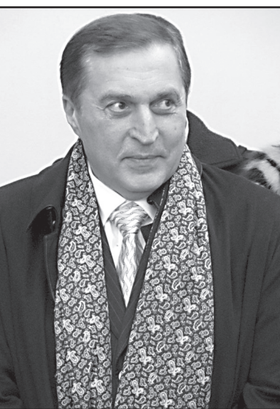
ოპონენტი ოპოზიცია კი არ არის, მთლიანად საზოგადოებაა, ხალხი, რომელიც ფიქრობს, რომ მას ცუდი ხელი-სუფლება ჰყავს და უარესი ოპოზიცია.

- ბარიერის პრობლემაში სერიოზული პრობლემა გაუჩნდება, რადგან საარჩევნო ოლქის მოსაგებად საჭიროა 50 პლუს ერთი ხმა. მიუხედავად ამისა, მაინც გამიჭირდება იმის თქმა, რამდენ ოლქში შეიძლება მეორე ტური გახდეს საჭირო, რადგან ოპოზიცია კიდევ უფრო სავალალო დღეშია, ვიდრე ხელისუფლება. „ქართული ოცნება“. ამ პრობლემაში რთული სათქმელია, რომ ხელისუფლებას რეალურად შეეძინას პრობლემა. უბრალოდ, არ ჩანს ოპოზიციური ძალა, რომელიც ხელისუფლებას რეალურ პრობლემას შეუქმნის. დღეს ხელისუფლების მთავარი