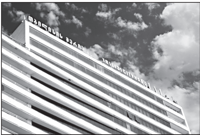
წელს ზაფხულის განმავლობაში იყო საუბარი ვაუჩერის გაცემა-არგაცემის შესახებ. მაგრამ იმის გამო, რომ ელექტროენერჯის ტარიფი გაიზარდა და იმის გამო, რომ გაზრდილი კომუნალური ხარჯები მოსახლეობის უკმაყოფილებას გამოიწვევდა თუ სხვა რამის გამო, მერიამ ვერ გაბედა ვაუჩერის გაცემას.

ელექტროენერჯისთვის – 8,45 ლარი, დასუფთავებისთვის – 8,40 ლარი, წყლის გადასახადისთვის 3,15 ლარი და ჯამში თვეში 20 ლარი გამოდიოდა.