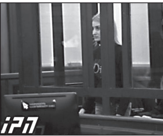
ქმარ-შვილის მკვლელობაში ბრალდებულს წინასწარი პატიმრობა შეეფარდა

– ამასთან, მე ვიცოდი, რომ ისინი მანქანით ვერ წავიდოდნენ, რადგან რამდენიმე