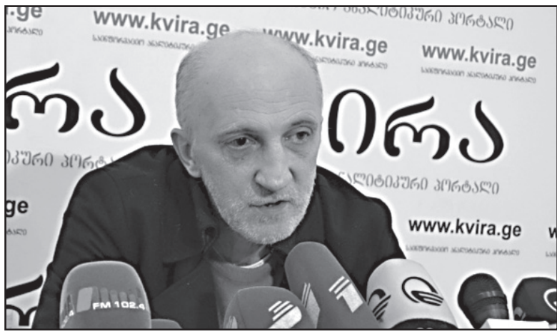
„ოპოზიცია კიდევ უფრო სავალალო დღეშია, ვიდრე „ქართული ოცნება“

- მთავარი, ფუნდამენტური პრობლემა მგონია ის, რომ მთლიანად პოლიტიკური ელიტა გაკორტირებულია. მათი ჯამური ლეგიტიმაცია სუსტია და ამ ფონზე გამიჭირდება სიმბაზიებს საუბარი. დღეს ძალაუფლება ქუჩაში აგდია. თუნდაც იმედგაცრუებული იყოს საზოგადოება ხელისუფლების მიმართ, პოლიტიკურ სტაბილიზაციას მაინც განაპირობებს ის, რომ ადამიანები სხვა არჩევანს ეძებენ და იქ პოულობენ შევებას, მომავლის იმედს, მაგ-