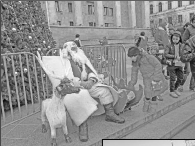
ახალი წლის დადგომასთან ერთად ნამდვილი ზამთრის საკადრის სუსხიც შემობრძანდა მთელს საქართველოში, ჩვენს საყვარელ დედაქალაქში.

ამიტომაც ახლა უკვე სრული დატვირთვით ამოქმედდა ზამთრის ყველა ის ატრაქციონი, რომელიც ასე უყვართ ჩვენს პატარებს. ამჯერად მხედველობაში გვაქვს საციგურაო მოედანი რესპუბლიკის მოედანზე. ეს დიდპატარასთვის მეტად მომზიბლავი გასართობი, ახალი წლის წინა დღეებშივე გაიხსნა, თუმცა კი გარკვეული ტექნიკური პრობლემების გამო, მაშინ მისი სრულფასოვნად ამოქმედება ვერ მოხერხდა, რაც