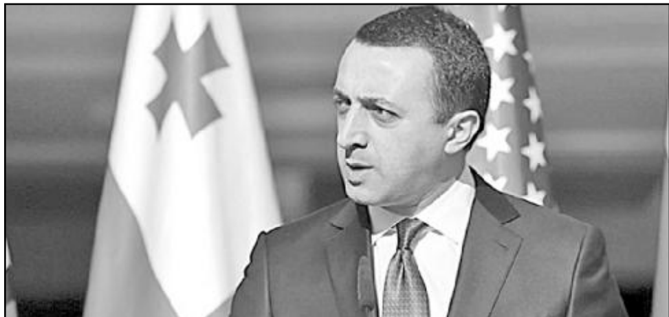
ციამ შეიძლება ახალი სტიმული შეიძინოს.