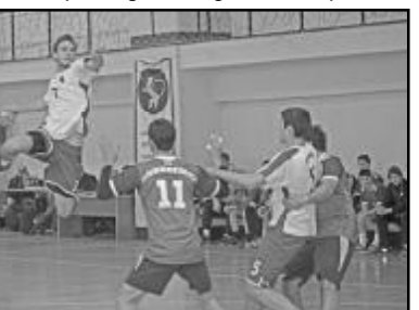
სპარეზობის დასკვნით დღეს დაძაბულად წარიმართა ჯგუფის ფაგორიტების - სტუ-ს და „პეგასის“ ორთაბრძოლა. შეხვედრის პირველ ნახევარში ანგარიში კარგა ხანს თანაბარი იყო, მაგრამ 37-ე წუთზე „პეგასი“ ერთი ბურთით გავიდა წინ - 21:20. მატჩის მიწურულს ჩემპიონებმა იძალეს და 34:31 გაიმარჯვეს. დრამატულად მიმდინარეობდა „იმედისა“ და „ქარიშხალს“ შეხვედრა. პირველ ტაიმში „იმედი“ 20:18 დანინაურდა, თუმცა მეორეში „ქარიშხალს“ ხელბურთელებმა უკეთ ითამაშეს და მატჩიც 38:34 მოიგეს.

მეორე ტურში სტუ-მ „იმედს“ პირველი ტაიმი 20:15 მოუგო, შესვენების შემდეგ ხუთბურთიანი უპირატესობა შეინარჩუნა და 34:29 გაიმარჯვა. „პეგასმა“ პირველი ტაიმის დასაწყისში „ქარიშხალს“ მოთოკა და 5 ბურთით გაიტანა წინ. ეტყობა, საქმე მომთავრებულად მიიჩნია და კინაღამ დაისაჯა - შესვენებამდე მეტოქემ ჯერ წონასწორობა აღადგინა, მერე სამი ბურთითაც დანინაურდა (21:18), თუმცა, „ქარიშხალმა“ მეორე ტაიმში ანგარიშის შენარჩუნება ვერ შეძლო და 36:39 დამარცხდა.