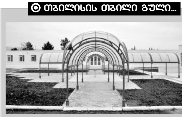
თბილისის თბილი გული...