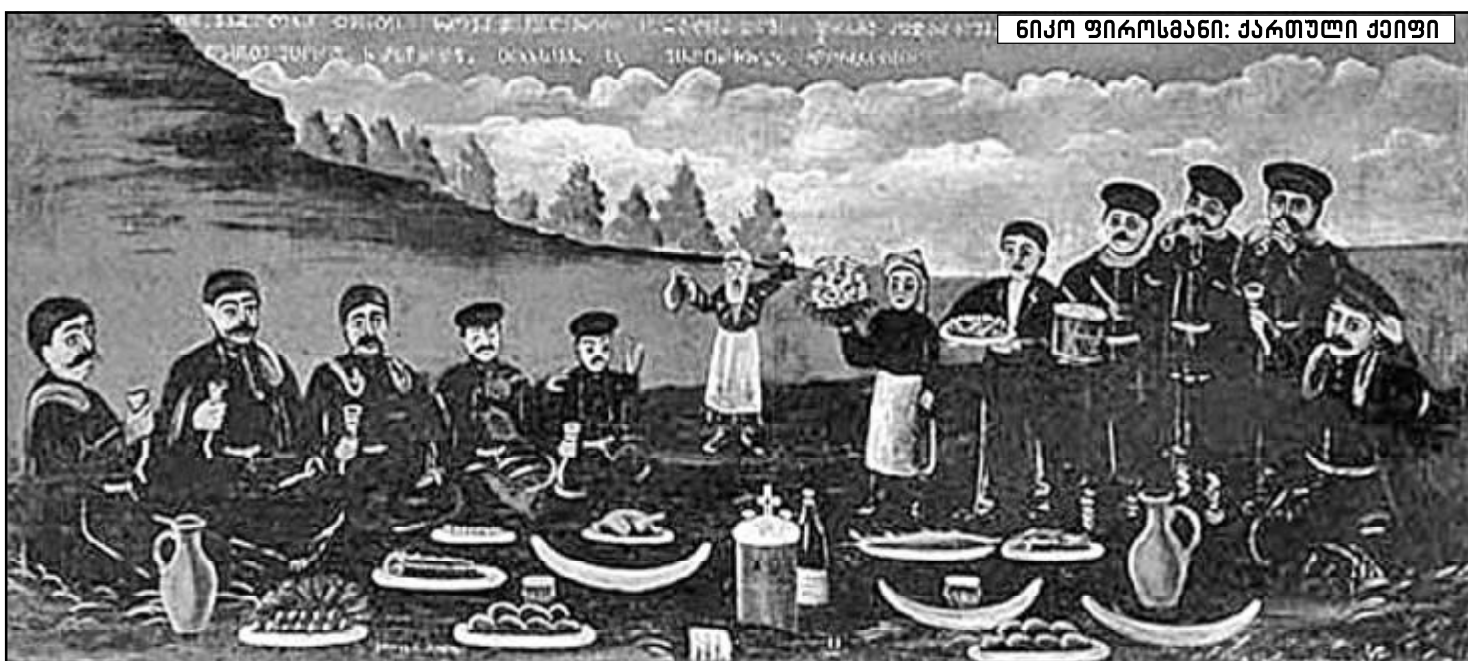
ნიკო ფიროსმანი: ქართული ქიფი