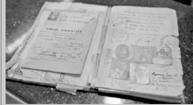
ესაუბრა თამარ ძარბაზა