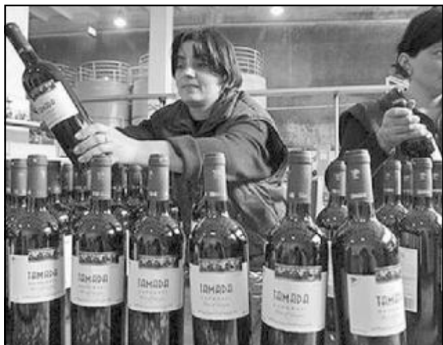
რეზერვუარი ასევე 118 890 ბოთლი (0,5 ლ) ჭაჭა. ეს კი თანხაში 466,3 ათასი აშშ დოლარია.

გასულ წელს მსოფლიოს 21 ქვეყანაში ექსპორტი-