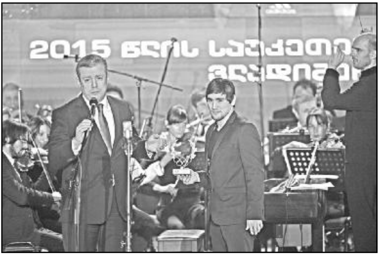
სამბოში მსოფლიოს და ევროპის ჩემპიონი.

სპორტის არაოლიმპიურ სახეობებში — ვახტანგ ჩიქრავაძე, სპორტული მსოფლიოს და ევროპის ჩემპიონი.