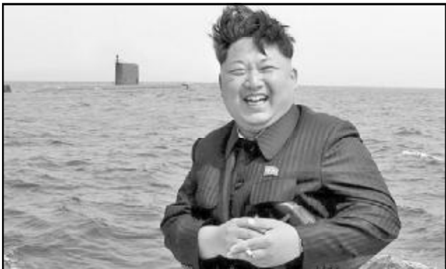
კაში გაიმართა მიტინგები წყალბადის ბომბის გამოცდის მხარდასაჭერად.

სპეციალისტებმა გააანალიზეს რამდენიმე კადრი ვიდეო, რომლებიც ჩრდილოეთი კორეა გამოაქვეყნა. ექსპერტები მივიდნენ დასკვნამდე, რომ ფანტაზიორები რედაქტირება გაუკეთა ძველ ჩანაწერს, რათა შექმნას რამდენიმე გაშვების ეფექტი, თუმცა გადაღებული იყო მხოლოდ ერთი. ამ დროს კორეის სახალხო-დემოკრატიულ რესპუბლიკაში