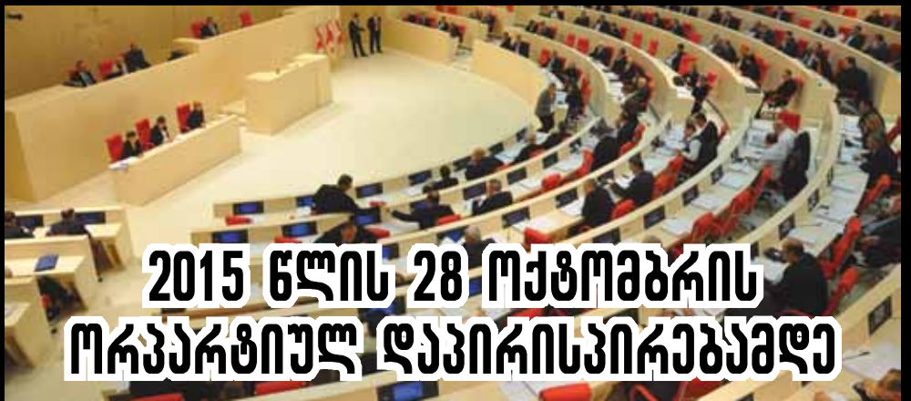
2015 წლის 28 თებერვლის ორპარტიულ დანიშნულებებზე

რა არის ბვიად გამსახურდისა და „ოცნების“ საერთო შეცდომა და რით ჰგავს ნაცემოდრობა კომპარტიას