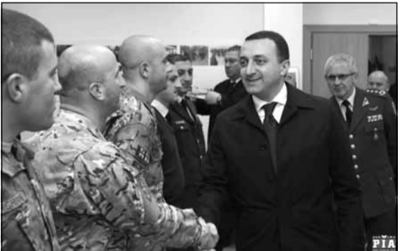
საქართველოს პრემიერ-მინისტრი ირაკლი ლარიბაშვილი (მარჯვნივ) ენერჯეტიკული უსაფრთხოების ცენტრის დირექტორს, პოლკოვნიკს გინტარას ბაგდონასს (მარჯვნივ) და ცენტრის საქმიანობის ძირითადი მიზანია ენერჯეტიკული უსაფრთხოების საკითხებზე სამეცნიერო, ტექნიკური და აკადემიური ექსპერტიზისა და ანალიზის წარმოება და ნატო-ს სტრატეგიული სარდლობის და ნატო-ს წევრი სახელმწიფოების კვალიფიციური რჩევებით უზრუნველყოფა. პოლკოვნიკმა პრემიერ-მინისტრს საქართველოს მიერ ცენტრის საქმიანობაში შეტანილი წვლილისთვის მადლობა გადაუხადა.

საქართველოს მთავრობის მეთაურმა ქართველ სამხედრო მოსამსახურეებსა და შტაბის წევრებთან სამახსოვრო ფოტო გადაიღო და საპატიო სტუმრების ნიგნში ჩანაწერი გააკეთა.