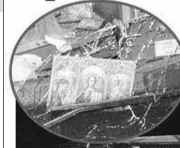
Schutzengel an Bord: Der Reisebus mit den Ikonen hinter der Windschutzscheibe überschlug sich – drei Insassen überstanden den Horror-Unfall unverletzt.