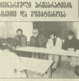
საქართველოს მთელი ტერიტორია...