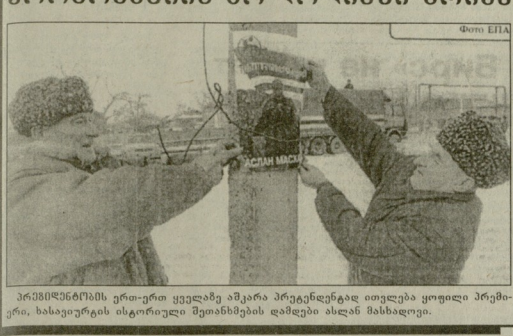
პრეზიდენტის ერთ-ერთი ყველაზე ახალი პრევიდენტული თემაა ყოფილი პრემიერის, ხასიავერის ცხარეული შეთანხმების დამტკიცება ახალი სახელისწილით.