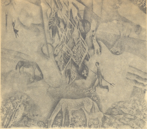
მ ა გ ხ უ ლ ი