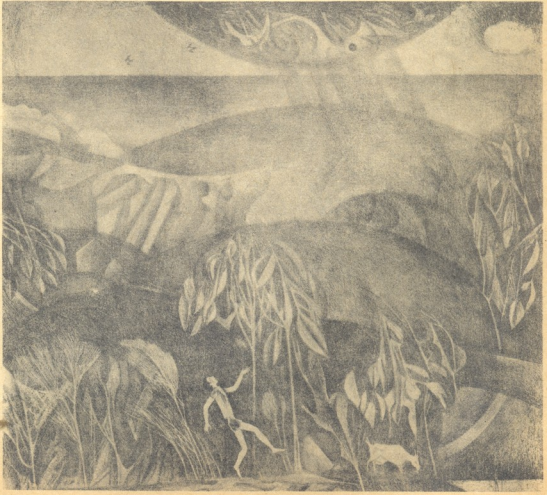
მ უ ა ლ დ ი