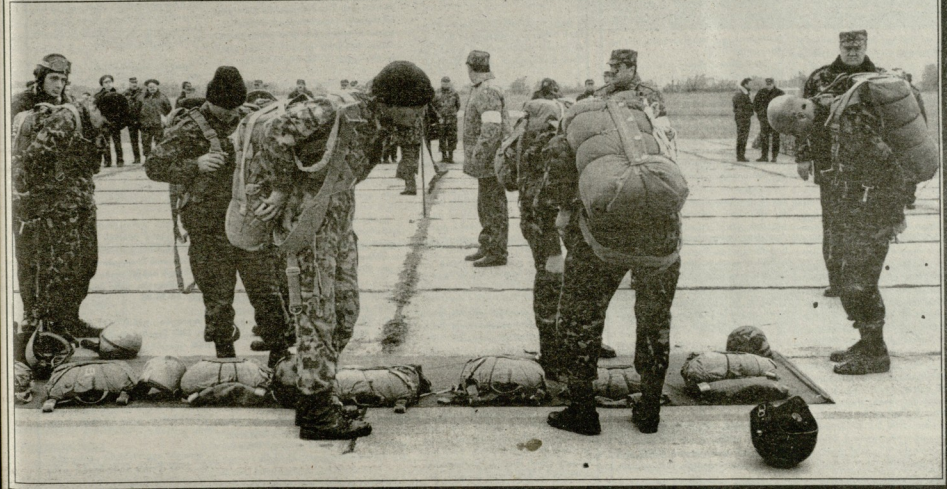
ბრძალვის შემდეგ, (საბურთაშის სვეც, კორ).