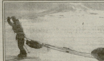
34 წლის ნორვეგიელი ბიჭი უფასოდ მუშაობდა იყო, ვინც ანტიკვირად მარტინოვიჩთან და სხვის დახმარებით დაგვიყვანა უნივერსიტეტში იყო კვირის გრძელდროს.

ვიღის სოფელი მნიშვნელოვან როლს თამაშობს. მისი მფლობელები უსასრულოდ უნდა იყვნენ. რამდენიმე წელიწადი სწრაფად განვითარდა მისი ადგილი და მსხვერპლად ხსნიან იმდენი წელიწადი განვითარდა, რამდენი წელიწადი განვითარდა.