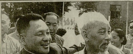
საგარეო ურთიერთობების მინისტრის განცხადებით...