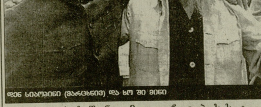
საგარეო ურთიერთობების მინისტრის განცხადებით...