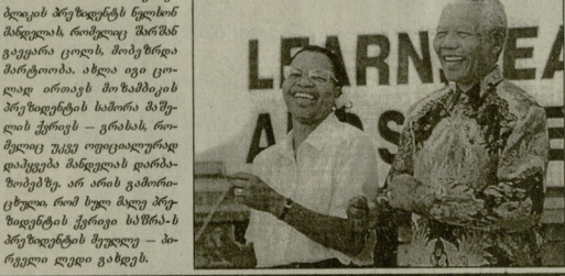
საგარეო ურთიერთობების მინისტრის განცხადებით...