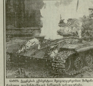
საგარეო ურთიერთობების მინისტრის განცხადებით...