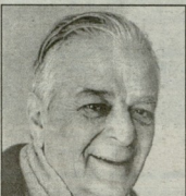
საქართველოს დემოკრატიული რესპუბლიკის პრეზიდენტი ივანე ჯავახიშვილი