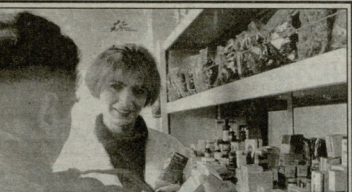
საქართველოს სპორტის განვითარების განყოფილებაში...