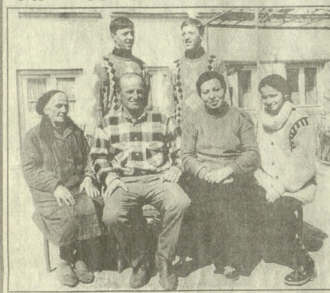
მღერე მუხომედიანი და მისი მოწოდებები

განმარტობის საზღვრებს გასულიყო. მათი მიზანია, რომ ქართული კინო ხელოვნებას საერთაშორისო დარგში წარმოადგინონ.