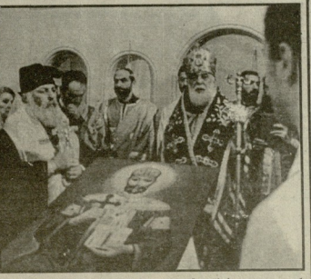
მრთი წელსწადა, რაც სრულიად საქართველოს კათოლიკოს-პატრიარქის, უწმიდის და უნეტარების ლეონ მთავრის მეთხველი თვითმოქმედის პირველი კორპუსის ეგზოზი დიდი შეფის — დავით აღმაშენებლის სახელმწიფო ეკლესია გაიხილა. ამით აღსდგა ეგზოზი მწიგნობრობისა და სულიერებისკენ.