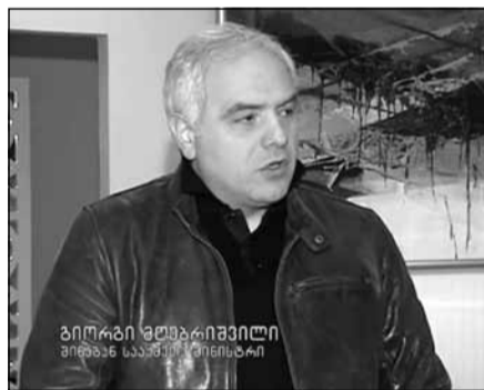
გიორგი მღებრივილი შინაგან საქმეთა მინისტრი

აღნიშნული შეხვედრების ფარგლებში განხილული იქნება აშშ-სა და საქართველოს სამართალდაცვითი სფეროს აქტუალური საკითხები, ისეთები როგორიცაა, საქართველოს სახელმწიფო საზღვრის გადაკვეთას თურქეთის რესპუბლიკის მიმართულებით ცდილობდნენ. გამოძიება საქართველოს სახელმწიფო საზღვრის უკანონოდ, ჯგუფურად გადაკვეთის მცდელობის ბრალდებით დააკავეს. ბრალდებულები, სასაზღვრო-საკონტროლო გამტარი პუნქტის გვერდის ავლით, საქართველოს სახელმწიფო საზღვრის გადაკვეთას თურქეთის რესპუბლიკის მიმართულებით ცდილობდნენ. გამოძიება საქართველოს სახელმწიფო საზღვრის უკანონოდ, ჯგუფურად გადაკვეთის მცდელობის ფაქტზე მიმდინარეობს (საქართველოს სსკ-ს 19-344-ე მუხლის მე-2 ნაწილის „ა“ ქვეპუნქტით). გამოძიება სასაზღვრო პოლიციის საგამოძიებო-ოპერატიული მთავარი სამმართველო ანარმოებს.