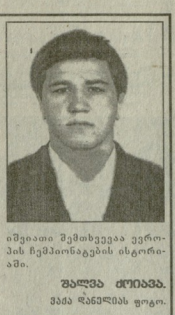
მედიის შემთხვევა ვერის ჩემპიონების ისტორია.