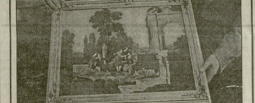
საზოგადოებრივი ცენტრის დაარსების შესახებ...