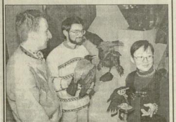
1907 წლიდან მოქმედებს ევოლუციის მუზეუმი...